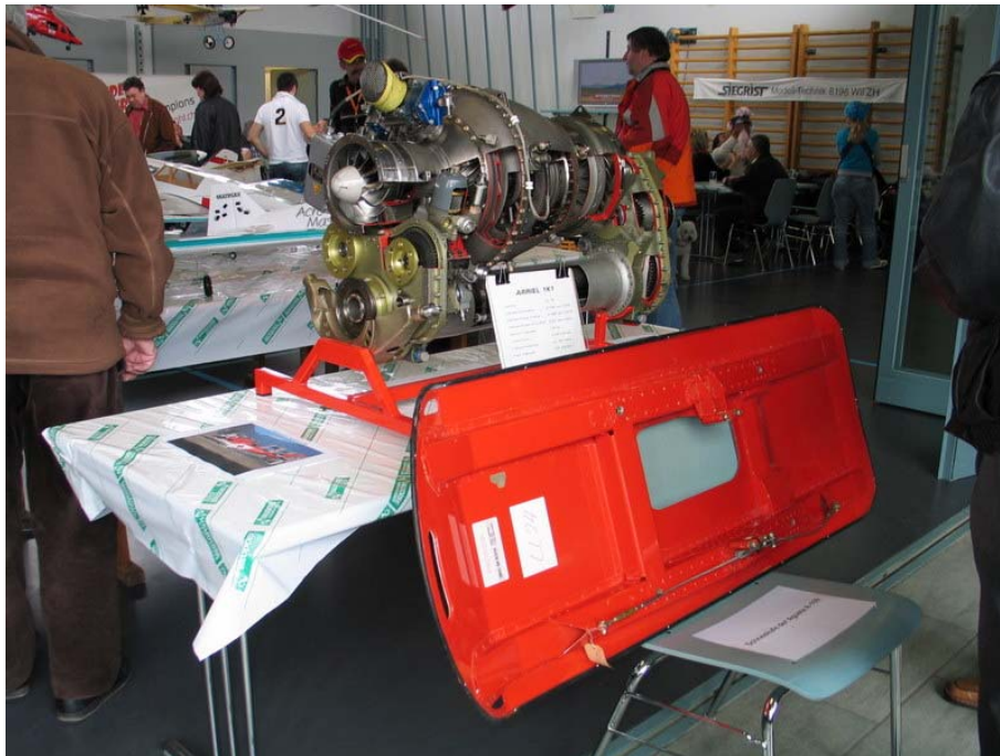
Das Agusta Triebwerk mit unserer Schneekufe im Vordergrund

Ich bedanke mich bei euch allen, den Sponsoren und Helfern und wünsche euch weiterhin eine gute Zeit.