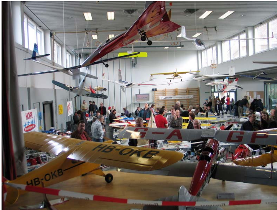
Sicht von der Bühne