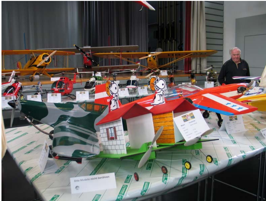
Die Hundehütten, die auch vor der Halle geflogen wurden